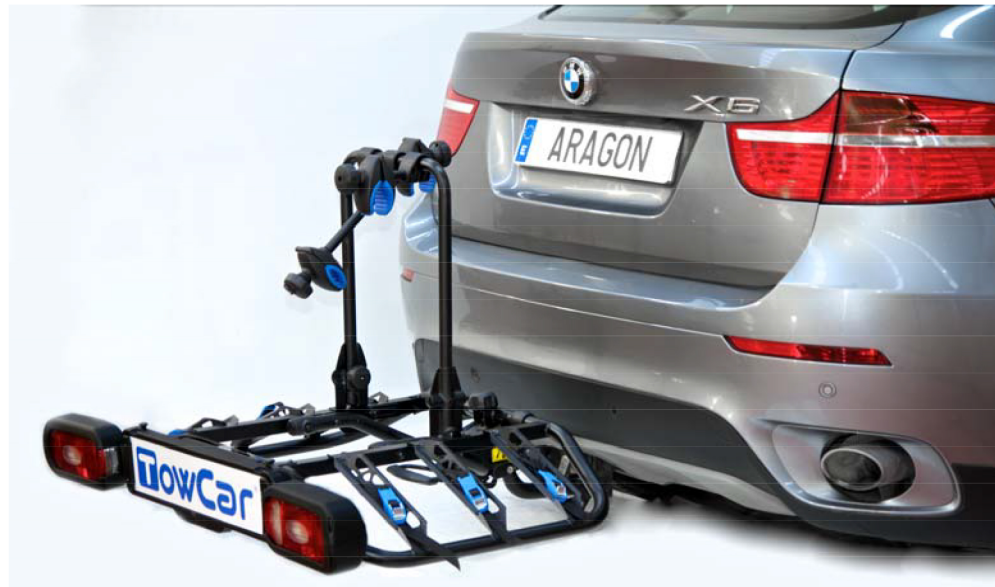
Versión mostrada / Displayed version : TCT 0003