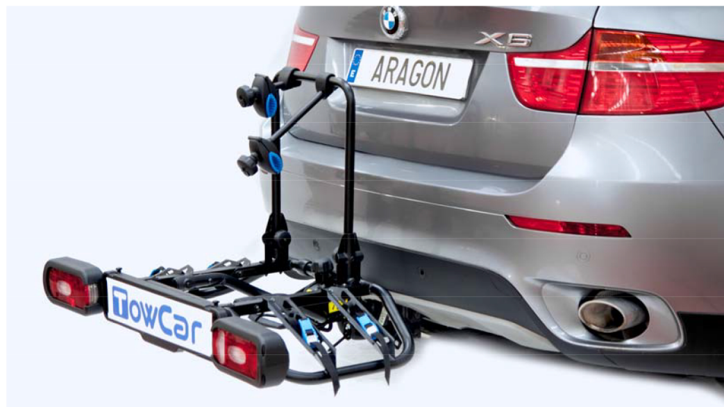
Versión mostrada / Displayed version: TCT 0002