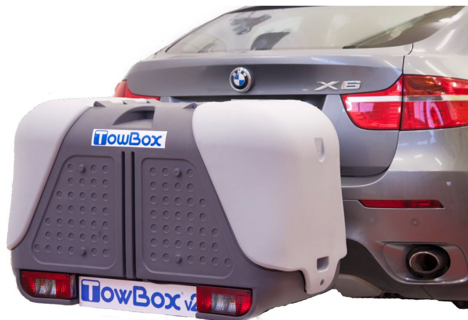
Versión mostrada / Displayed version: TBX