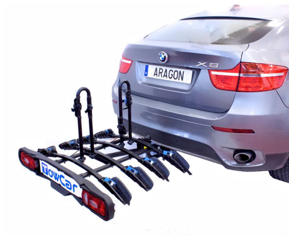
Versión mostrada / Displayed version : TCB 0004