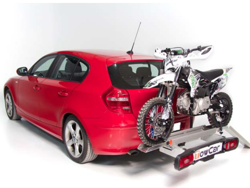
Versión mostrada / Displayed version : AEPM 000