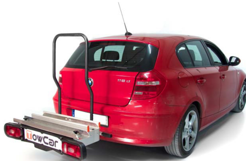
Versión mostrada / Displayed version : AEPM 000